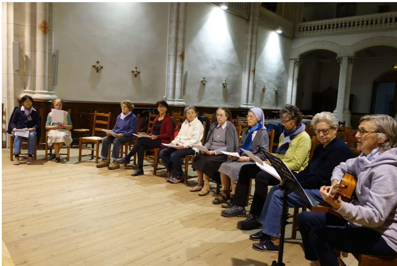
Célébration à la Chapelle du Grand Couvent.